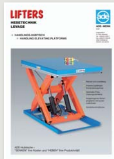
Handlings-Hubtisch Handling elevating platforms