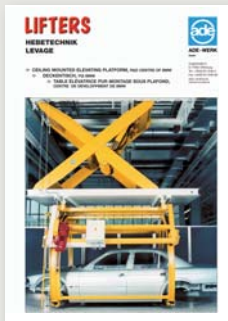
Anlagen-Hubtisch Elevating platform systems