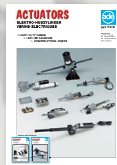
Mini-Hubgetriebe Light-duty range