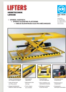
Spindel-Hubtisch Spindle elevating platforms