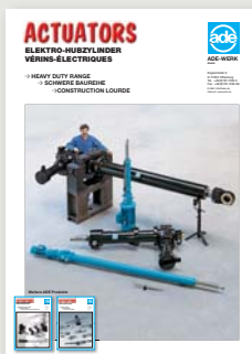
Schwere Baureihe Heavy-duty range