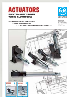
Standard-Baureihe Standard industrial range